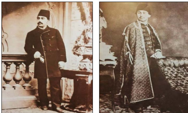
تصویر ۱۴. دوست محمدخان پیش از عزیمت به اروپا، حدود ۱۲۹۳ ق [۱۷، ص ۹۰]، تصویر ۱۵. دوست محمدخان در اروپا، دهه ۱۳۰۰ ق [همان]

استاد محمدعلی چخماق‌ساز و میرزا حاجی‌بابا، که برای آموزش طب و نقاشی به اروپا اعزام شدند، نخستین گروه دانشجویانی بودند که به فرنگ رفتند [۳۳، ص ۷۵]. این گروه از طرف عباس‌میرزا، ولیعهد فتحعلی‌شاه، اعزام فرنگ شدند. اعزام دانشجویان در دوره فتحعلی‌شاه آغاز می‌شود و در دوره ناصرالدین‌شاه به اوج خود می‌رسد که «یک گروه ۴۲ نفری به سرپرستی مرحوم حسنعلی‌خان امیرنظامی گروسی به فرانسه اعزام شدند» [همان، ص ۷۹]. این اقدامات خواه‌ناخواه گامی جهت انتقال و سرایت آداب و رسوم اروپایی به جامعه ایرانی بوده است. پس با ایجاد نخستین مدرسه به سبک جدید، توسط کشیشی امریکایی در عهد محمدشاه در شهر ارومیه، مقدمات پوشش به سبک اروپایی نیز فراهم شد. دومین مدرسه را نیز کشیشی فرانسوی در سال ۱۲۵۵ ق در تبریز دایر کرد [۲۹، ص ۶۷۰] که ناصرالدین میرزای ولیعهد نیز به تصمیم مادرش- مهد علیا- برای یادگرفتن زبان فرانسه به این مدرسه رفت. اقدام اروپایی‌ها در زمینه ایجاد اصلاحات آموزشی با خواست ایرانیان برای کسب دانش و پیشرفت تمدن منطبق شد و گام‌هایی در جهت اصلاحات آموزشی برداشته شد؛ که به تدریج درهای مدارس جدید فرانسوی، امریکایی و امثال آن در پایتخت قاجار (تهران) به روی دختران و پسران باز شد [۲۱، ص ۱۲۰]. سیاست: بنابر شواهد تاریخی، نقش زنان به‌عنوان قدرت سیاسی در دوره متأخر نسبت به دوره متقدم پررنگ‌تر شد؛ به‌طوری‌که زنان در دو جبهه نسبتاً متعارض شروع به فعالیت کردند. از یک‌سو نقشی بود که دسته‌ای از زنان در تسهیل حرکت جامعه رو به جهان مدرن غربی ایفا