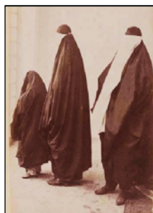
تصویر ۹. زن دربار فتحعلی‌شاه در پوشش بیرون از خانه [۴۹، ص ۲۲۸]. تصویر ۱۰. زنان عصر ناصری در پوشش بیرون از خانه [۵۷، ص ۳۳]

روبنده: از عناصر مهم و در حقیقت کامل‌کنندهٔ حجاب زنان هنگام بیرون رفتن از خانه بود. زنان علاوه بر چادر و «چاقچور» با پارچه‌ای از کتان سفید به پهنای شصت تا هفتاد سانتی‌متر صورت را تا قسمتی از جلوی سینه می‌پوشاندند، که روبنده نامیده می‌شد.