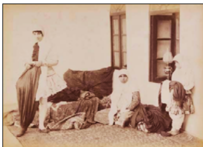
تصویر ۱۱. زن درحالی که تُنبان را در چاقچور جا می‌دهد، دوره ناصرالدین‌شاه [۵۷، ص ۳۴]

چاقچور: شلواری بود که لیفه و بند داشت و در قسمت مچ پا چین می‌خورد [۴۲، ص ۴۶۲]. پولاک رنگ چاقچورها را سبز یا آبی کم‌رنگ توصیف می‌کند، اما سفرنامه‌نویس دیگری در توضیحی کامل‌تر آن را آبی تیره و گاهی بنفش و اگر سیده باشند، سبز معرفی می‌کند. به‌علت گشادی و چین‌دار بودن چاقچور- همان‌طور که در تصویر ۱۱ دیده می‌شود- همه شلیته (تُنبان)ها به‌راحتی داخل آن جا می‌گرفت. زنان بسیار مراقب بودند آهار و برآمدگی شلیته‌ها نشکند و هنگام راه رفتن مشخص بود که تُنبان پنبه‌دار یا فنردار پوشیده‌اند. رنه دالمانی ۱ چاقچور را به‌نوعی کفش تشبیه کرده که از پنجه تا ساق پا را دقیقاً دربرمی‌گیرد و از پارچه پنبه‌ای یا ابریشمی است [۱۴، ص ۴۱۵].