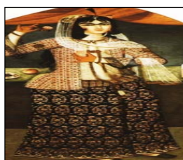
تصویر ۵. تُنبان بلند دوره فتحعلی شاه [۴۹، ص ۲۰۵]. تصویر ۶. شلیته کوتاه شده، دوره ناصرالدین شاه [۱۷، ص ۲۸]