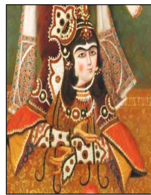
تصویر ۳. آرخالق با سنبوسه‌های کارشده، دوره فتحعلی شاه [۵۷، ص ۳۲]، تصویر ۴. آرخالق، دوره ناصرالدین شاه [۱۸، ص ۷۶]