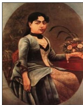
تصویر ۱۶. تاج السلطنه (دختر ناصرالدین شاه) [۱۲، ص ۴۶۳]. تصویر ۱۷. زن ناصرالدین شاه در پوشش چادر نماز (روپوش بلند) [۱۷، ص ۳۴]

جدول ۳. تطبیق مد لباس بانوان دو دربار فتحعلی شاه و ناصرالدین شاه با تأکید بر مؤلفه‌های فرهنگ و سیاست