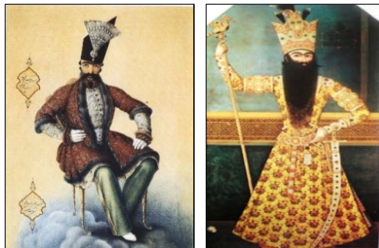
تصویر ۱۸. فتحعلی شاه ملبس به پوشش فاخر و مرصع کاری شده [۵۰، ص ۱۵]، تصویر ۱۹. ناصرالدین شاه با پوششی متأثر از تزیینات کم لباس فرنگی، ۱۲۷۰ ق [۴۹، ص ۲۴۲]

ناصرالدین شاه طی سفرهایی که به مسکو داشت، مُد و نگاه غربی را برای پوشاک بانوان درباری به ارمغان آورد. ۱ همچنین، در تصویری به جامانده از آنیس الدوله (همسر سوگلی ناصرالدین شاه) وی در حالی دیده می شود که عروسکی ساخت فرنگ در دست دارد (تصویر ۲۰). در واقع، ناصرالدین شاه در جهت ارزش هایی از غرب گرایی قدم می گذارد که اجدادش چون عباس میرزا آرزوی تحقق آن را داشته اند. در نتیجه، الگوهای ذهنی فتحعلی شاه و ناصرالدین شاه- با آنکه هر دو از یک تیره و نژاد و یک سلسله پادشاهی بودند- متفاوت بود و سبب می شد هر یک به شیوه خاص خود تحت تأثیر عوامل محیطی واقع شوند.