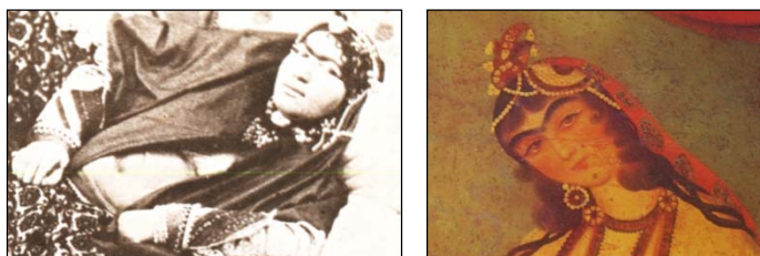
تصویر ۷- زن با شال و کلاهک جواهرنشان بر فرم جقه، دوره فتحعلی‌شاه [۴۹، ص ۲۳]. تصویر ۸- انیس‌الدوله (همسر ناصرالدین‌شاه) در پوشش چارقد و حلقه گل [۱۷، ص ۳۲]

مشخص است که این رکن در دوره فتحعلی‌شاه جنبه کاربردی- همراه با تزیین- داشته، ولی در دوره بعد- هم‌زمان با مُد شلیته‌های کوتاه- تا حد زیادی جایگاه خود را از دست داد- عنوان «چارقد» به خود گرفت- و یکی از سرپوش‌های اصلی زنان اندرونی شد (تصویر ۸). چارقد عبارت بود از پارچه‌ای نازک و مربع‌شکل که از قطر مربع تا می‌شد و به مثلث تبدیل می‌شد، سپس آن را طوری روی سر قرار می‌دادند که زاویه قائمه پشت سر قرار بگیرد و در جلو به اندازه گردی صورت، آن را به کمک سنجاق زیر چانه محکم می‌کردند. به دلیل اینکه چارقدها- در مقایسه با کلاهک و توری- شکلی ساده‌تر داشتند، زنان با ابتکاری همچون «چارقد قالبی» ۲ تا حدودی بُعد تزیینی سربند را- که از گذشته مرسوم بود- حفظ کردند.