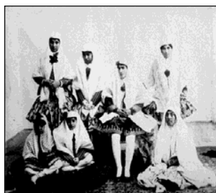
تصویر ۱۲. جمعی از زنان حرم‌سرای ناصری در پوشش شلیته‌های کوتاه (چارقد) [۵۶، ص ۱]. تصویر ۱۳. زنان در پوشش بیرونی، دوره ناصرالدین‌شاه [۴، ص ۲۳]

با تطبیق دو دوره مذکور در بستر مذهب، درمی‌یابیم با اینکه مذهب در دوره ناصری رو به تزلزل گذاشت، تغییرات رخ داده در مد لباس به نادیده انگاشتن گرایش‌های مذهبی منجر نشد. این در حالی است که در دوره فتحعلی‌شاه (همان‌طور که در ذیل مقایسه اجزای پوشاک ذکر شد)، مد لباس وام‌دار سبک پوشش پیش از خود بود. از این رو، در دوره ناصری همچنان بالاپوشی چون آرخالق برای جبران نازکی پیراهن زنان به کار گرفته شد و چادرنماز نیز برای جبران کوتاهی قد دامن زنان ابداع شد. جدول ۱ به بررسی حفظ و تغییر ارکان لباس در بستر مذهب می‌پردازد.